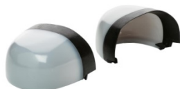
Puntera no metálica