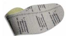
Plantilla de protección flexible