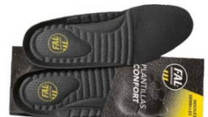
Plantillas extraíbles. Lavables