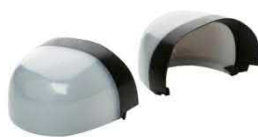
Puntera no metálica