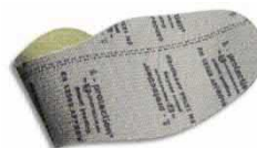
Plantilla de protección flexible