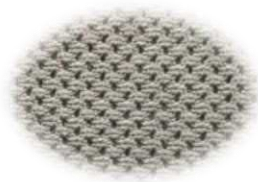
Forro de cuello transpirable