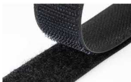
Tira de Velcro