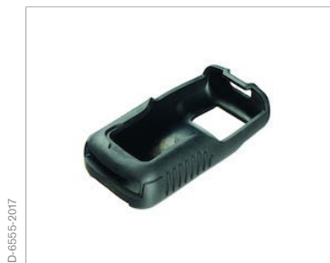
Funda protectora de goma