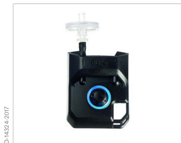
Adaptador de bomba