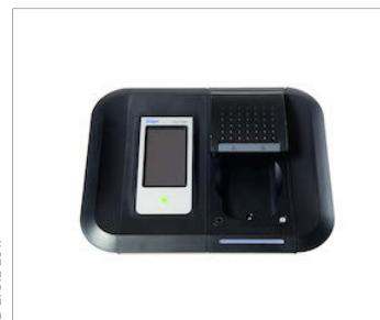
Módulo Dräger X-dock®