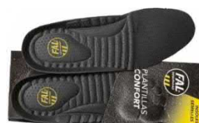
Plantillas extraíbles. Lavables