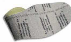
Plantilla de protección flexible