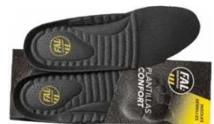
Plantillas extraíbles. Lavable