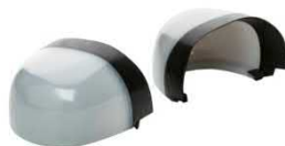
Puntera no metálica