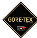
Membrana del forro impermeable + transpirable