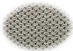
Forro de cuello transpirable