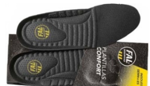
Plantillas extraíbles. Lavable