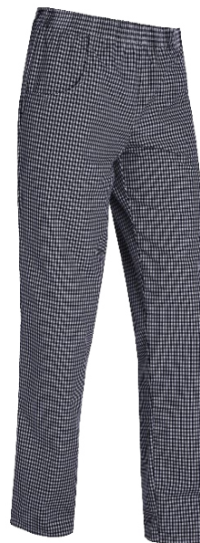
C:25 Cuadro azul