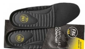
Plantillas extraíbles. Lavable